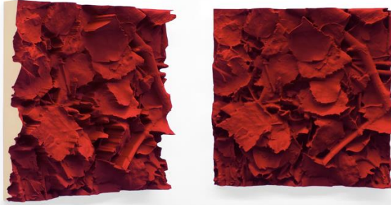
《Carmin Ground》，2016, 有色聚氯乙炔聚氨基, 50 x 50 cm

印象派藝術家大師克勞德·莫奈是其中一位 Juri 早期作品的靈感來源。Juri 在 21 歲到訪布拉格的途中，回想起自己接觸莫奈《魯昂大教堂》系列畫作時驚嘆的樣子，回家前嘗試研究莫奈是如何創作的。在 2017 年 5 月，Juri Markkula 到訪法國盧昂及莫奈的工作畫室，是次的朝聖之行或會影響他日後的藝術創作方向。