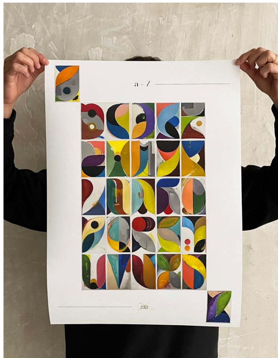
Print a - Z, 2021 Impresión sobre papel 200g 42x59,4cm 50€*

* Hazte con un póster sólo este fin de semana en el Mercado de Diseño por 40€ Contacta directamente con el artista vía instagram (@yes.jm) o e-mail (jesus.moreno.yes@gmail.com)