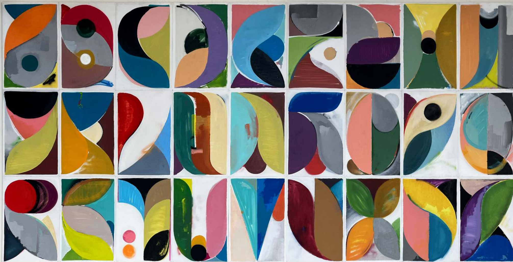
a-Z, 2021 Técnica mixta sobre tabla Mixed media on wood 122x81cm