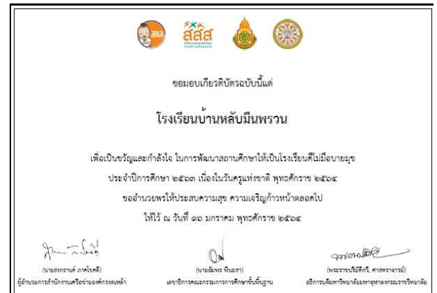
เกียรติบัตรโรงเรียนดีไม่มีอบายมุข ปีการศึกษา 2563