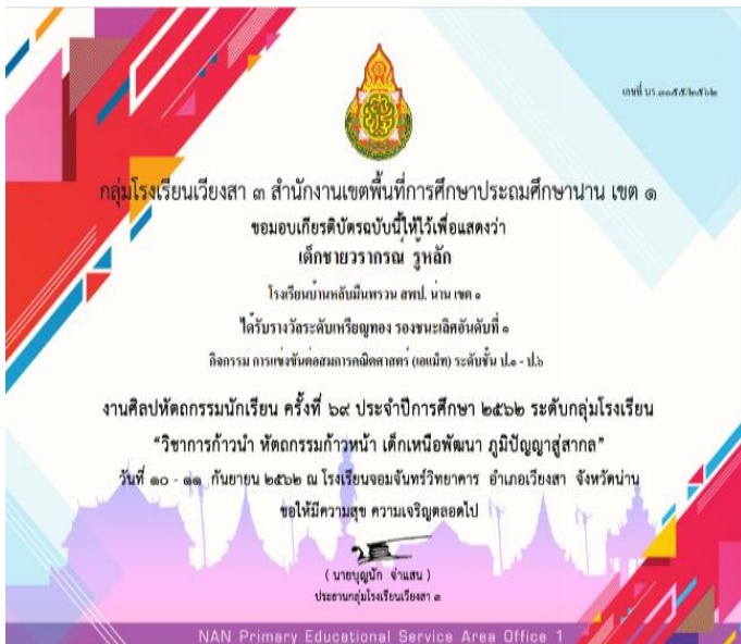
เด็กชวยรกรณณ์ รุห์หลัก ได้รับเกียรติบัตร รางวัลเหรียญทอง รองชนะเลิศอันดับที่ 1 การแข่งขันต่อสมการคณิตศาสตร์ (เอแม็ท) ระดับชั้นป.1-6 งานศิลปหัตถกรรมนักเรียน ครั้งที่ 69