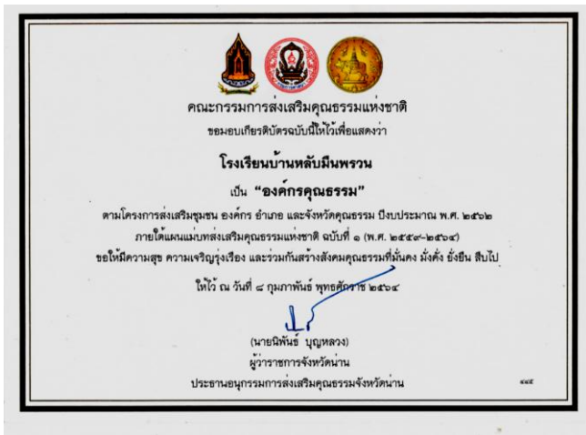
เกียรติบัตรองค์กรคุณธรรม