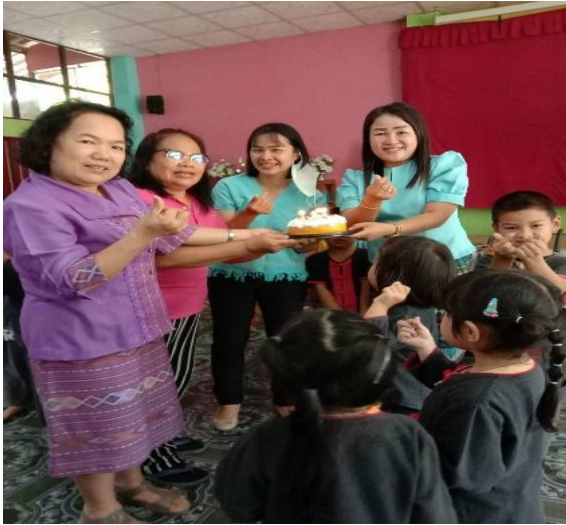
จรรยาบรรณต่อเพื่อนผู้ร่วมประกอบวิชาชีพ