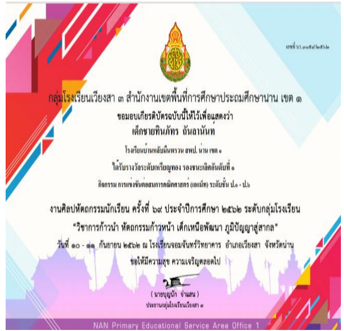
เด็กชายทินภัทร ถันลานันท์ ได้รับเกียรติบัตร รางวัลเหรียญทอง รองชนะเลิศอันดับที่ 1 การแข่งขันต่อสมการคณิตศาสตร์ (เอแม็ท) ระดับชั้นป.1-6 งานศิลปหัตถกรรมนักเรียนครั้งที่ 69