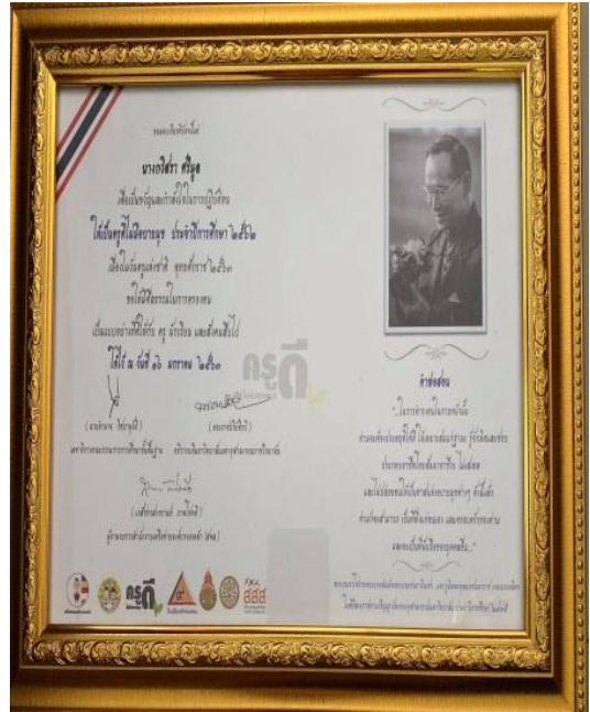
เกียรติบัตร ครูดีไม่มีอบายมุข ประจำปีการศึกษา 2562 ประเภทผู้บริหารสถานศึกษา