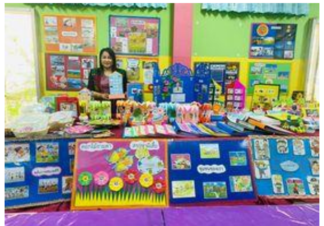
จัดนิทรรศการแลกเปลี่ยนเรียนรู้