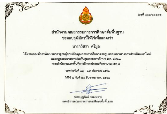
เกียรติบัตร ผู้ผ่านการสัมมนาเชิงปฏิบัติการการพัฒนา มาตรฐานผู้ประเมินคุณภาพการศึกษาตามแนวทางการ ประเมินแนวใหม่ จาก สพฐ.