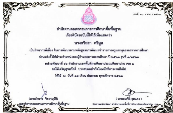
เกียรติบัตร วิทยากรพี่เลี้ยง ในการพัฒนาตามหลักสูตร การพัฒนาข้าราชการครูและบุคลากรทางการศึกษา ก่อนแต่งตั้งให้ดำรงตำแหน่งรองผู้อำนวยการสถานศึกษา ปี 2563 รุ่นที่ 1/2563 ตำแหน่ง รองผู้อำนวยการสถานศึกษา ปี 2563 รุ่นที่ 1/2563 จาก สพฐ.

ข้าพเจ้ามีความมุ่งมั่นตั้งใจในการปฏิบัติงานโดยยึดหลักการการบริหารแบบใช้โรงเรียนเป็นฐาน เน้นการมีส่วนร่วมของทุกฝ่าย คือร่วมคิด ร่วมทำและร่วมรับผิดชอบ ร่วมยินดีในผลสำเร็จของงาน ในการบริหารและพัฒนาคุณภาพสถานศึกษาที่เป็นโรงเรียนขนาดเล็ก มีนักเรียน 65 คน ครูตาม จ.18 จำนวน 4 คน ครูอัตราจ้าง โดยใช้งบประมาณของสถานศึกษา จำนวน 3 คน การบริหารงานท่ามกลางข้อจำกัดหลายๆ ด้าน ข้าพเจ้าต้องใช้ทักษะ ความรู้ ความสามารถมาใช้ในการบริหารจัดการ และสามารถบริหารจัดการได้เป็นอย่างดี มีประสิทธิภาพ สามารถพัฒนาคุณภาพของโรงเรียนให้ก้าวหน้ามาโดยตลอด ดังจะเห็นได้จากผลงานที่ประสบ