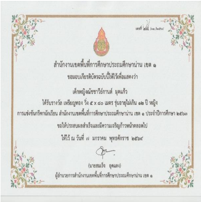
เด็กหญิงณัชชาวิทย์ มุดแก้ว เกียรติบัตร รางวัลเหรียญทอง วัง 5x 80 เมตร รุ่นอายุไม่เกิน 12 ปีหญิง การแข่งขันกรีฑานักเรียน สำนักงานเขตพื้นที่การศึกษาประถมศึกษา น่าน เขต 1