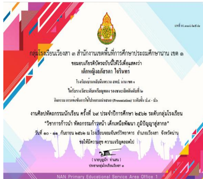
เด็กหญิงลภัสสดา ไจรินทร์ ได้รับเกียรติบัตรรางวัลเหรียญทอง รองชนะเลิศอันดับที่ ๒ การแข่งขันการใช้โปรแกรมนำเสนอ (Presentation) ระดับชั้น ป.4-6 งานศิลปหัตถกรรมนักเรียน ครั้งที่ 69