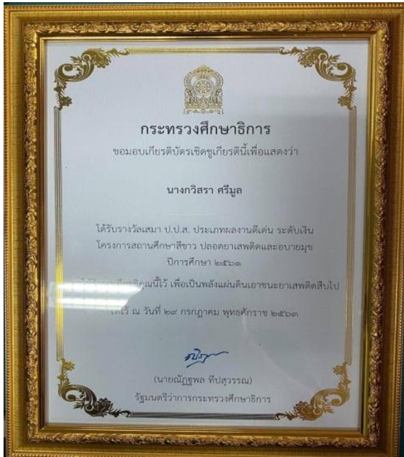
เกียรติบัตร เสนา ป.ป.ส. ประเภทผลงานดีเด่น ระดับเงิน ปีการศึกษา 2561