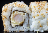
كريم تشيز تيمبورا Cream Cheese Tempura 3.2 OMR