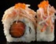
كرايزي سالمون Crazy Salmon 3.4 OMR