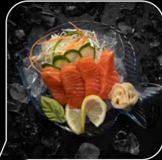
Salmon Sashimi سالمون ساشيمي 4 OMR 4 PCS