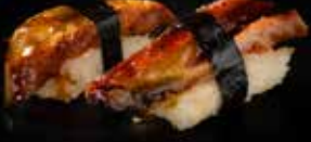
اوناقى نڱيري Unagi Nigiri 4.1 OMR 2 PCS