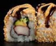
سويت اند سبايسي تيمبورا Sweet & Spicy Tempura 3.2 OMR