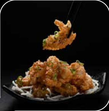
دايناميت شريمب Dynamite Shrimp 3.9 OMR