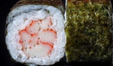
هوسو ماکي کراب Hoso Maki Crab 2.8 OMR