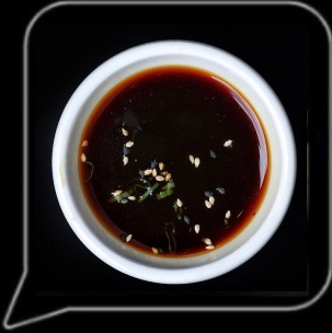
0.3 OMR بونزو صوص Ponzu Sauce