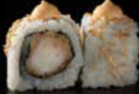
سبايسي تيمبورا Spicy Tempura 3.1 OMR