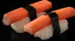
كراب نڱيري Cani Crab Nigiri 2.7 OMR 2 PCS