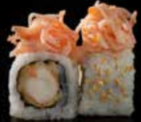
كرايزي تيمبورا Crazy Tempura 3.3 OMR