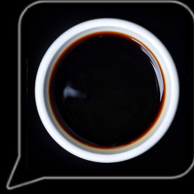
0.3 OMR صويا صوص Soya Sauce