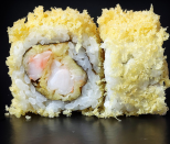
كريسبي تيمبورا Crispy Tempura 3.1 OMR