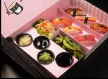
Nigiri Combo نيغيري كومبو 8.9 OMR