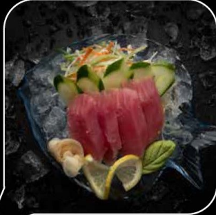
Tuna Sashimi تونا ساشيمي 4 OMR 4 PCS