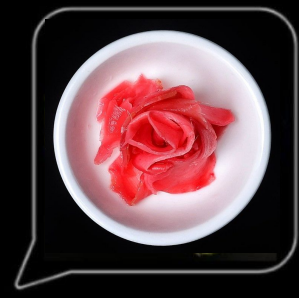
0.3 OMR مخلل الزنجبيل Ginger Pickles