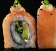
سموكد سالمون Smoked Salmon 3.5 OMR