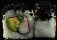
سيشيل كاليفورنيا Special California 3.4 OMR