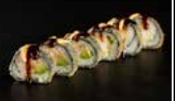
ديب فراي 99 Deep fry 99 3.5 OMR 6 PCS