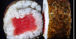
هوسو ماکي تونا Hoso Maki Tuna 3.1 OMR