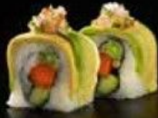
في ايت رول V8 Roll 3.4 OMR