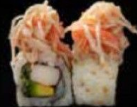
كرايزي كاليفورنيا Crazy California 3.4 OMR