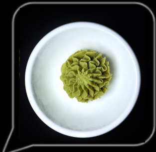
0.3 OMR واسابي Wasabi