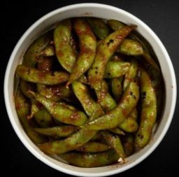
ايدامامي بالملح Salt Edamame 2.8 OMR