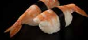
شرمب نڱيري Shrimp Nigiri 2.8 OMR 2 PCS