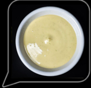
0.3 OMR افوكادو صوص Avocado Sauce