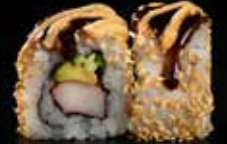
سويت اند سبايسي كاليفورنيا Sweet & Spicy California 3.150 OMR