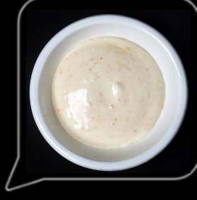
0.3 OMR مايونيز بالثوم Garlic Mayo