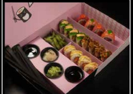
Me So Yummy مي سو يمي 15 OMR