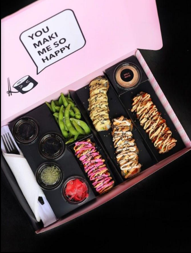
Mini Fried Platter مینی فراید بلاٹر 13 OMR