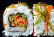
فيجي فيجي رول Veggie Veggie Roll 2.9 OMR