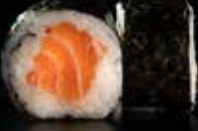
هوسو ماکي سالمون Hoso Maki Salmon 3 OMR