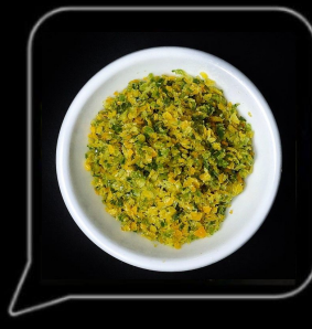
0.3 OMR فلفل يوزو ياباني Yuzu Japanese Pepper