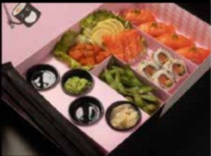
Salmon Combo سالمون كومبو 11.7 OMR