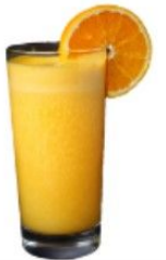
عصير البرتقال Orange Juice 1.8 OMR