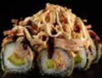
سبايدر رول Spider Roll 4 OMR 6 PCS