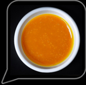
0.3 OMR هوني ماسترد Honey Mustard