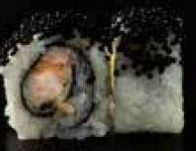
سيشيل تيمبورا Special Tempura 3.4 OMR