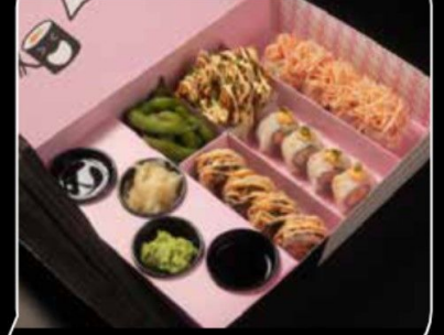
Mini yummy 5 ميني يمي 5 10.5 OMR