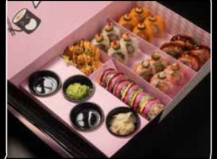
Mini yummy 6 ميني يمي 6 13.5 OMR