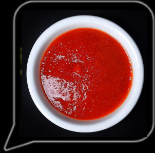
0.3 OMR شطة سريراتشا Sriracha Hot Sauce