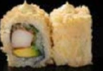
كريسبي كاليفورنيا Crispy California 3.2 OMR