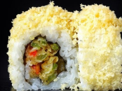
کرنشي فيجي Crunchy Veggie 3 OMR