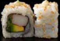
كاليفورنيا California 3 OMR