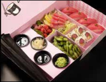
Tuna Combo تونا كومبو 12 OMR