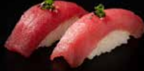
تونا نڱيري Tuna Nigiri 2.8 OMR 2 PCS