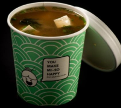
شوربة الميسو اليابانية Miso Soup 1.5 OMR