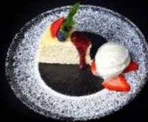
تشیز کیک یابانی 3.5 OMR Japanese Cheese Cake