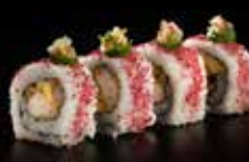
اميغو رول Amigo Roll 4.1 OMR 6 PCS