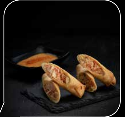
كاني كراب سيرينج رول Kani Crab Spring Roll 2 pcs 2.3 OMR