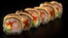
فرايد هيروشيما Fried Hiroshima 3.6 OMR