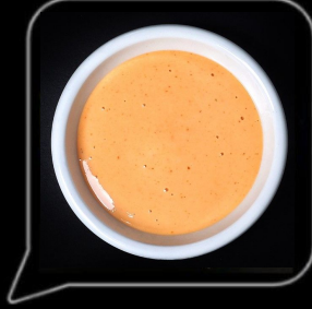
0.3 OMR دايناميت صوص Dynamite Sauce