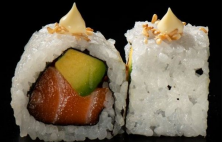
سالجون افوكادو رول Salmon Avocado Roll 3.25 OMR