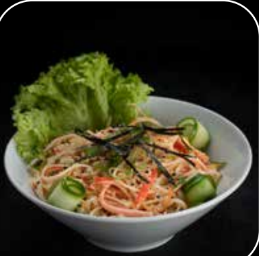
سلطة الكراب Crab Salad 3.9 OMR