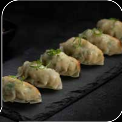
جايزا يابانية بالجمبري ٦ قطع Japanese Shrimp Gyoza 6 pcs 2.9 OMR