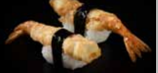
شريمب تيمبورا نڱيري Shrimp Tempura Nigiri 2.7 OMR 2 PCS