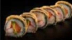
فرايد سالمون کراب Fried Salmon Crab 3.7 OMR