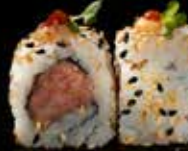
سبايسي تونا Spicy Tuna 3.3 OMR