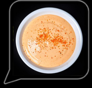
0.3 OMR سبايسي مايو Spicy Mayo