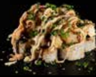
دايناميت فولكينو مطبوخ Dynamite Volcano Roll 5.5 OMR 6 PCS