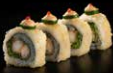
فاير رول Fire Roll 3.5 OMR 6 PCS