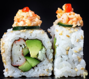
سبايسي كاليفورنيا Spicy California 3 OMR