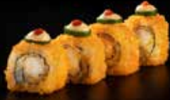
شيتوس رول Cheetos Roll 4.3 OMR 6 PCS