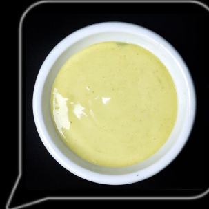
0.3 OMR واسابي مايو Wasabi Mayo