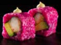
بريتي رول Pretty Roll 3.1 OMR