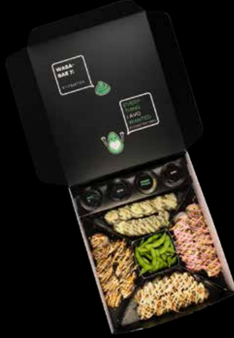
Yummy 5 Platter یمی فایف بلاٹر 19.8 OMR