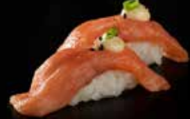
سموكد سالمون نڱيري Smoked Salmon Nigiri 2.8 OMR 2 PCS