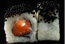
رول سلمون خاص Special Salmon Roll 3 OMR