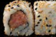
سبايسي سالمون Spicy Salmon 3.2 OMR