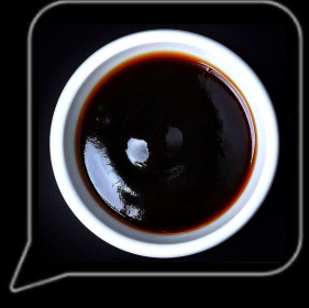
0.3 OMR ترياكي صوص Teriyaki Sauce