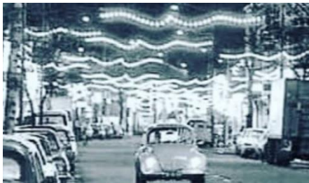
De Noorderboulevard voorwaarts!

Vlak na de oorlog was zij de beste winkelstraat in Rotterdam, met triple A status. De bouw van nieuwe winkelgebieden – Lijnbaan en Alexandrium - zorgde voor meer Rotterdams keuzeaanbod maar ook voor meer leegstand in de Noorderboulevard. De economische crisis van 2007 deed een schepje bóvenop de leegstand. De toename van online shopping en het gemak daarvan zorgt voor minder bezoekers aan fysieke winkels. De huidige leegstand is beperkt tot < 10%, augustus 2020. De laatste bezoekersstromen meting rekende minimaal 2000 en maximaal 3500 / bezoekers per dag. Het weekend tot 5.000. Vanzelfsprekend is er i.v.m. Corona ook aandacht voor de veiligheid van de bezoekersstromen.