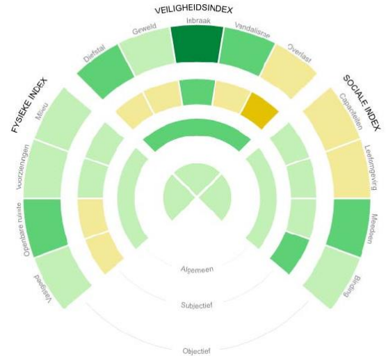
Wijkprofiel Oude Noorden 2018