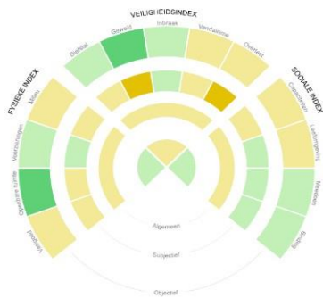
Wijkprofiel Oude Noorden 2016