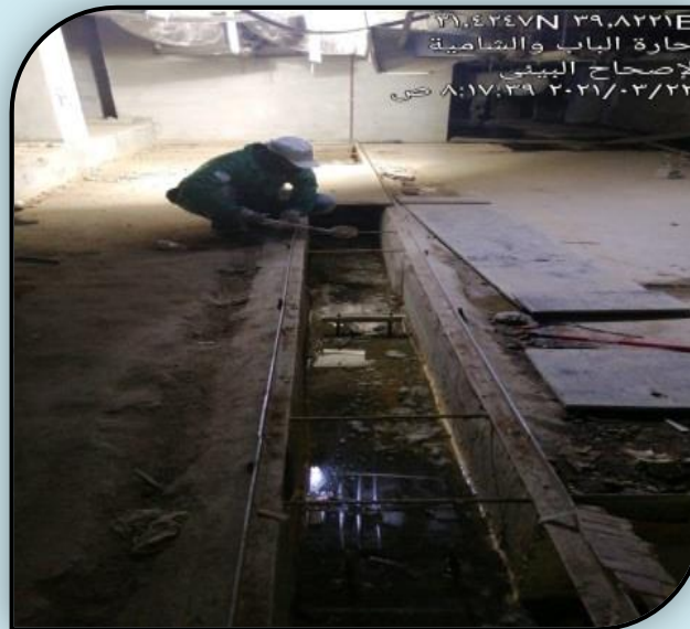
٢١.٤٢٤٧N ٣٩.٨٢٢١E حارة الباب والشامية الإصحاح البيئي ٢٠٢١/٠٣/٢٢ من ٨:١٧:٢٩ ص