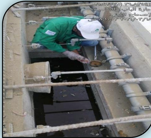
٢١.٤٢٥٧N ٣٩.٨٢٣٤E حارة الباب والشامية الإصحاح البيئي ٢٠٢١/٠٣/١٨ من ٨:١٠:٣٢ ص