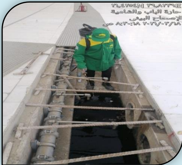
٢١.٤٢٥٧N ٣٩.٨٢٣٤E حارة الباب والشامية الإصحاح البيئي ٢٠٢١/٠٣/١٨ من ٨:٣٠:١٨ ص