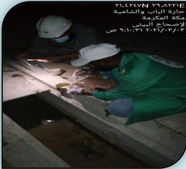
٢١.٤٢٤٧N ٣٩.٨٢٢١E حارة الباب والشامية مكة المكرمة الإصحاح البيئي ٢٠٢١/٠٣/٠٣ من ٩:١٠:٣١ ص