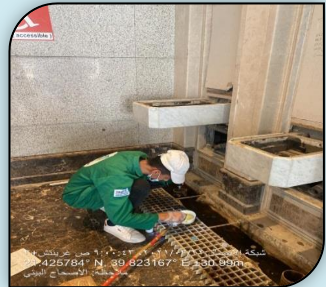
شبكة الصرف الصحي ٢٠٢١/٠٣/٢١ من ٩:٠٠:٤٣ ص 21.425784° N, 39.823167° E 130.99m محافظة: الأصحاح البيئي