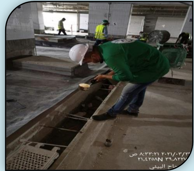
٢٠٢١/٠٣/٢١ من ٨:٣٣:٢١ ص ٢١.٤٢٥٨N ٣٩.٨٢٣٧E حارة البيئي