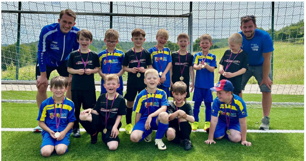
Strahlende Gesichter beim Jugendturnier in Kroppach