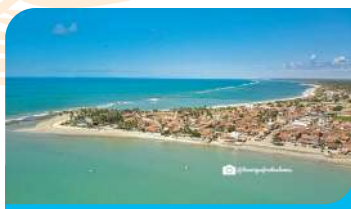
Pontal das Trincheiras (Praia Central)