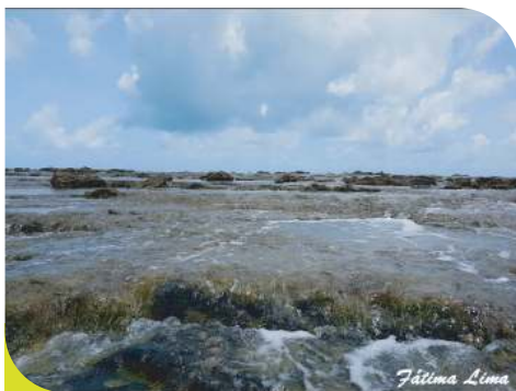
Arrecife de Corais - Prainha