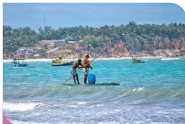
Pescadores na Praia Central