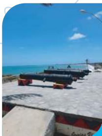
Canhões do Forte (Aldeia do Forte)