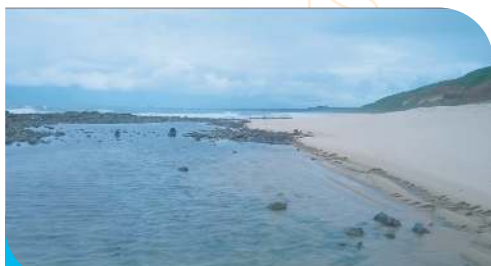
Praia da Cardoso