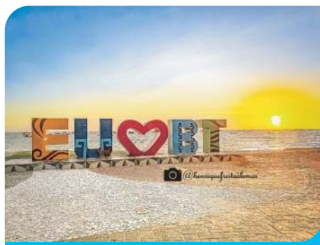
Monumento Turístico Eu Amo Bt (Praça em frente a Prefeitura)

A BAÍA DA TRAIÇÃO é um dos antigos núcleos de colonização da Paraíba. Um município repleto de histórias desde os primórdios da colonização do Brasil, fazendo parte de uma das Capitânicas Hereditárias, onde foi palco de batalhas sangrentas entre os Potiguaras habitantes desta terra e os portugueses que queriam colonizar o local, uma etnia que foi bastante perseguida e massacrada por questões religiosas e fundiárias. Pertencentes a grande família linguística do tronco Tupi.