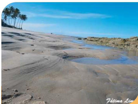
Praia da Baía