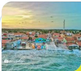
Monumento Turístico Eu Amo Bt. Vista aérea