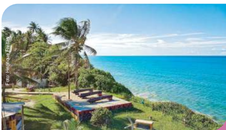
Mirante do Forte - Toré Forte