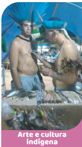
Arte e cultura indígena