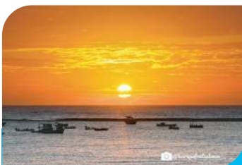
Praia Central - Por Sol