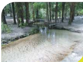
Rio do Dendezeiro (Aldeia Cumaru)