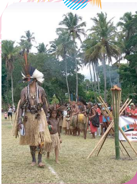
Pajé Jovem Potiguar

Na Baía existem vários roteiros ambientais, como caminhadas por trilhas, áreas pouco frequentadas, de preservação e conservação.