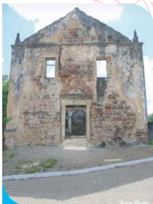
Ruínas da Igreja São Miguel

Descubra a Baía da Traição O paraíso é aqui!