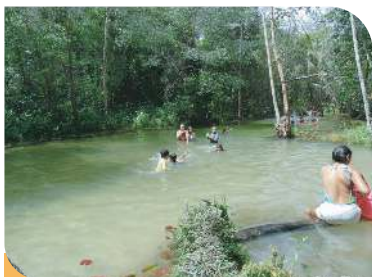
Rio do Gozo (Aldeia Tracoeira)