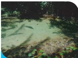
Nascente do Rio do Gozo