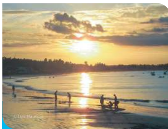
Praia Central - Por Sol