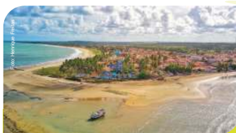
Pontal da Prainha

O turista desfruta da natureza, apreciando a fauna e flora; este é o diferencial da Baía com cenários de vários pontos de atração turística, como falésias, arrecifes de corais, manguezais, marés e praias paradisíacas para práticas esportivas, surf dentre outros.