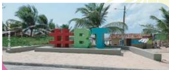
Monumento Turístico #BT (Prainha)