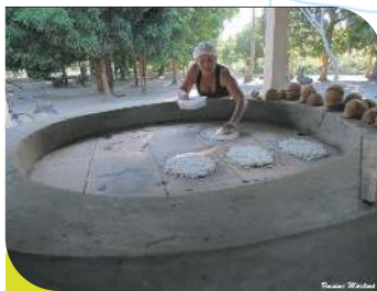
Casa do Beijú (Aldeia Alto do Tambá)

Baía da Traição tem Diversidade Cultural