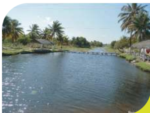
Rio Sinimbu (Aldeia São Miguel)