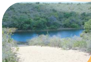
Lagoa Encantada (Aldeia Lagoa do Mato)

Descubra a Baía da Traição O paraíso é aqui!