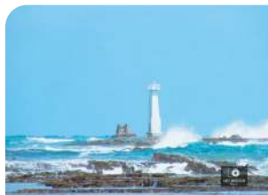
Farol Antigo e Novo