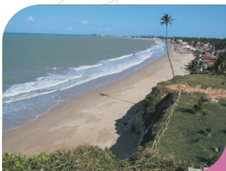
Vista da Cidade