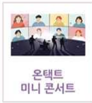
온택트 미니 콘서트