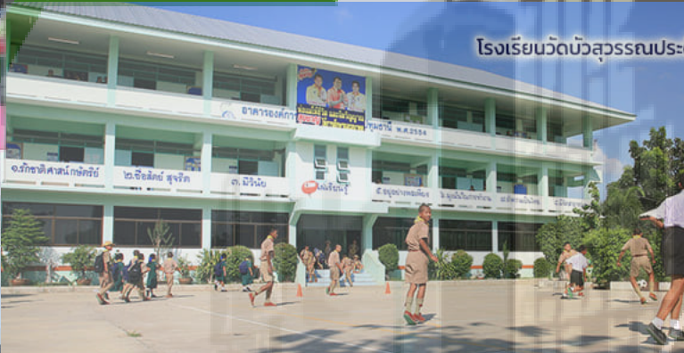
โรงเรียนวัดบัวสุวรรณประดิษฐ์

โรงเรียนวัดบัวสุวรรณประดิษฐ์ สำนักงานเขตพื้นที่การศึกษาประถมศึกษาปทุมธานี เขต 1