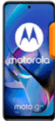
Moto G54 256 GB