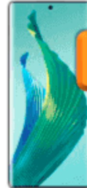
Honor Magic 5 Lite 256 GB