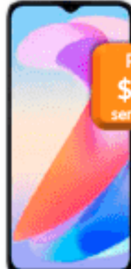
Honor X6A Plus 256 GB