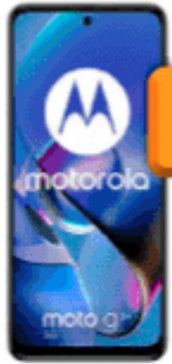
Moto G54 128 GB