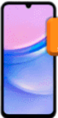
Galaxy A15 LTE