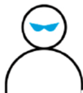
ROBO (con o sin violencia)

Es el servicio que brinda AT&T a nuestros clientes para brindarle protección a su smartphone, dentro de este seguro se cubren tres rubros: