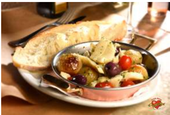
Caçarola de Bacalhau

Lascas de bacalhau, azeitonas pretas, tomate cereja, azeite mini cebola e temperos aromáticos. Acompanha fatias de pão italiano