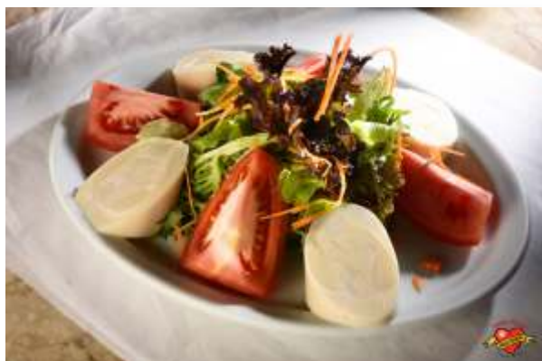
Salada da Nonna

15 Salada da Nonna R$39,00 Mix de folhas, cenoura ralada, tomates frescos e palmito.