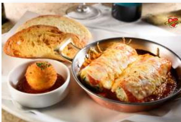
Canelloni de ricota

Molho sugo, mozzarella e parmesão gratinado.