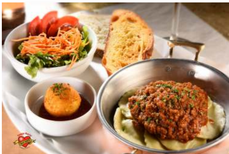
Ravioli de Ricota a Bolonhesa

Bife á rolê com bacon, cenoura, parmesão e azeitonas. Molho rústico e temperos aromáticos Acompanha massa seca penne ao molho pomodoro e basílico