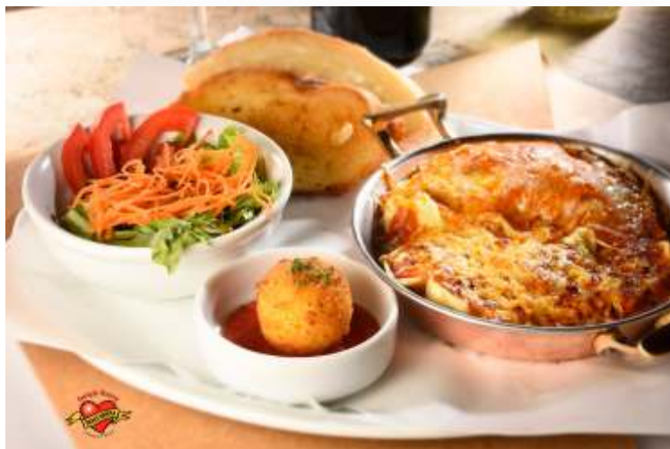
1/2 Berinjela a parmegiana 1/2 Capeletti

Massa fresca recheada com carne. Molho de tomates frescos apurados com temperos aromático