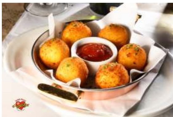
Porção de arancini

210 Porção de arancini R$47,00 6 unidades de bolinho de risoto de açafrão recheado com mozzarella Acompanha geleia de tomate levemente picante.