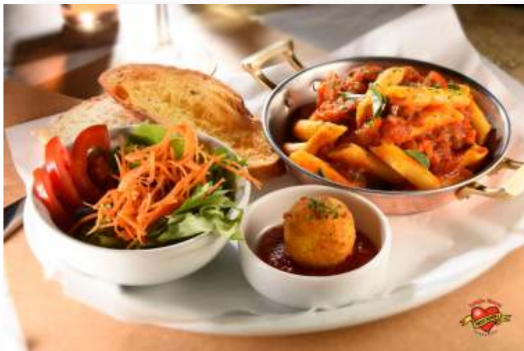
Penne com Calabresa

Massa verde recheada com molho bolonhesa e mozzarella Molho sugo, mozzarella e parmesão gratinado.