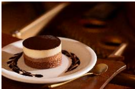
Torta Três Mousses

Pedaço de torta em três camadas de mousses: chocolate meio amargo, ao leite e branco com base de pão de ló de chocolate. Servido com calda de chocolate e iogurte