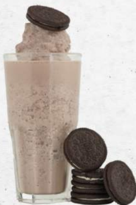
オレオミルクセーキ NEW Oreo Milkshake