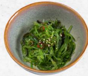
中華ホタテ Chuka Wakame