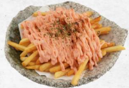
明太マヨフライドポテト NEW French Fries with Mentaiko