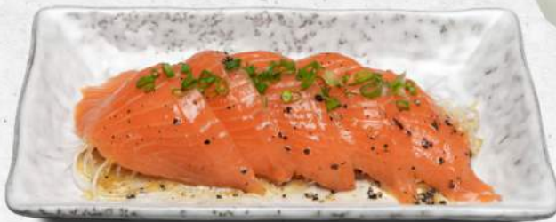
サーモンのカルパッチョ 👏 Salmon Carpaccio