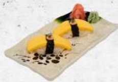
卵明太子炙り握り Tamago Mentai Aburi Nigiri