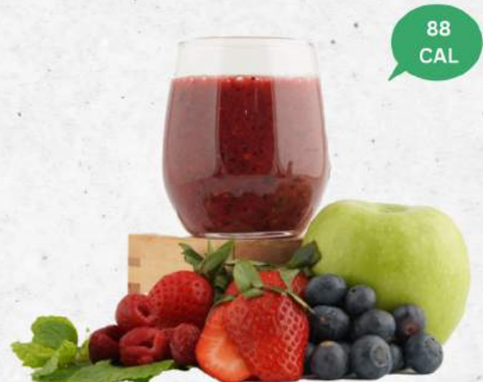
酸化防止剤 NEW Antioxidant (Strawberry, Raspberry, Blueberry, Green Apple)