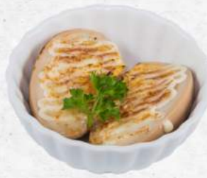
炙り煮卵 Golden Lava Egg