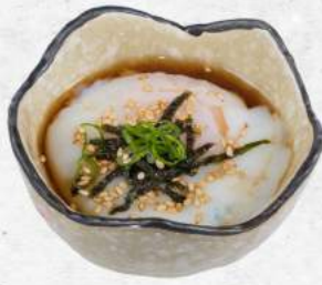
温泉卵 Onsen Tamago