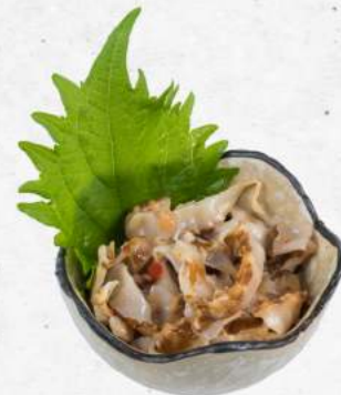
中華ホタテ Chuka Hotate