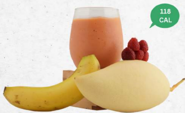
応力緩和 NEW Stress Relief (Banana, Raspberry, Mango)