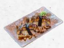
鰻握り Unagi Nigiri