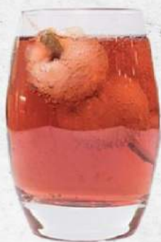
ライチベリー焼酎 Lychee Berries Shochu

Not valid for diners below 18 years old.