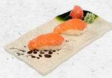
サーモン握り Salmon Nigiri