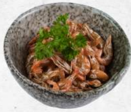
川エビフライ NEW Kawa Ebi