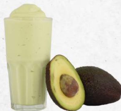
アボカドのミルクセーキ Avocado Milkshake