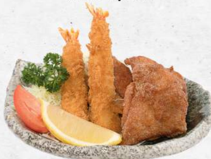
エビフライと唐揚げ NEW Ebi Fry & Chicken Karaage