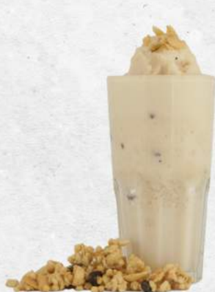
プレミアム大豆ナッツスムージー Premium Soy Nut Smoothie