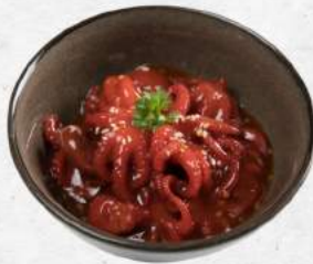
中華いいだこ Chuka lidako