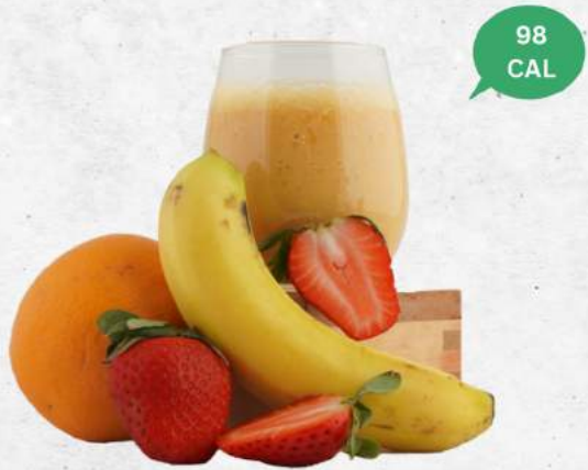
デトックス NEW Detox (Banana, Strawberry Orange)