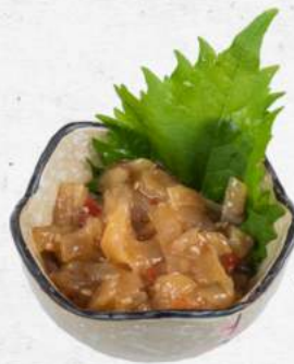
中華クラゲ Chuka Kurage