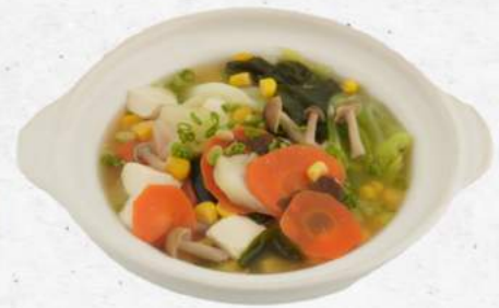
野菜みそ汁 NEW Yasai Miso Soup