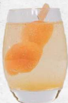
杏桃焼酎 Apricot Peach Shochu