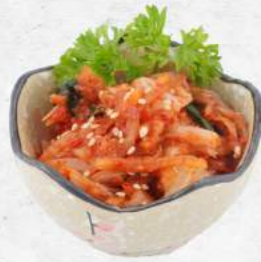
韓国キムチ NEW Korean Kimchi