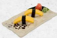
卵握り Tamago Nigiri