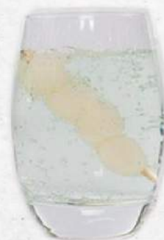
リュウガンキュウリ焼酎 Longan Cucumber Shochu