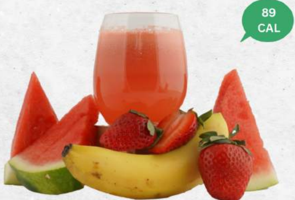
免疫エナジザー NEW Immunity Energizer (Watermelon, Strawberry, Orange)