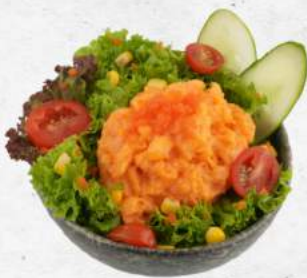
海老子入りロブスターサラダ NEW Lobster Salad with Ebiko