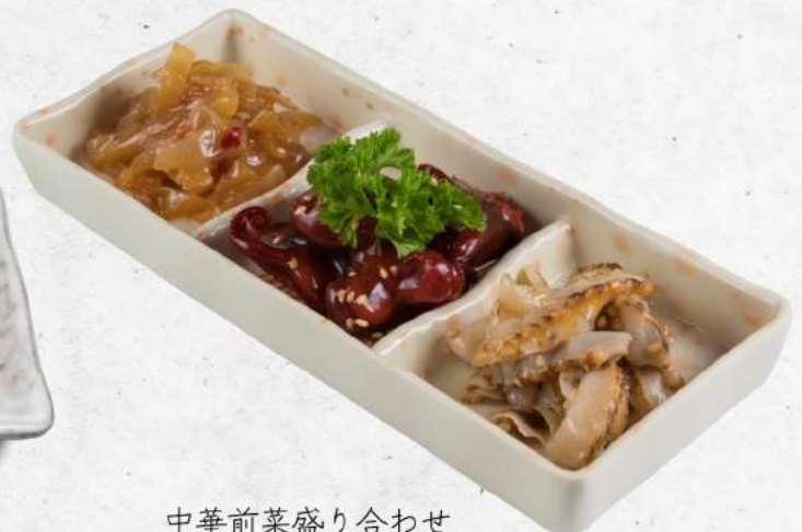
中華前菜盛り合わせ 👏 Chuka Platter