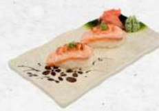
サーモン明太子炙り握り Salmon Mentai Aburi Nigiri