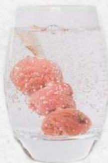
梅焼酎 Ume Shochu