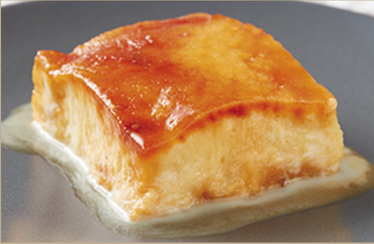
Torrija caramelizada de brioche

Torrija jugosa a base de leche, canela y pan de brioche. Tostada con azúcar y yema pastelera.