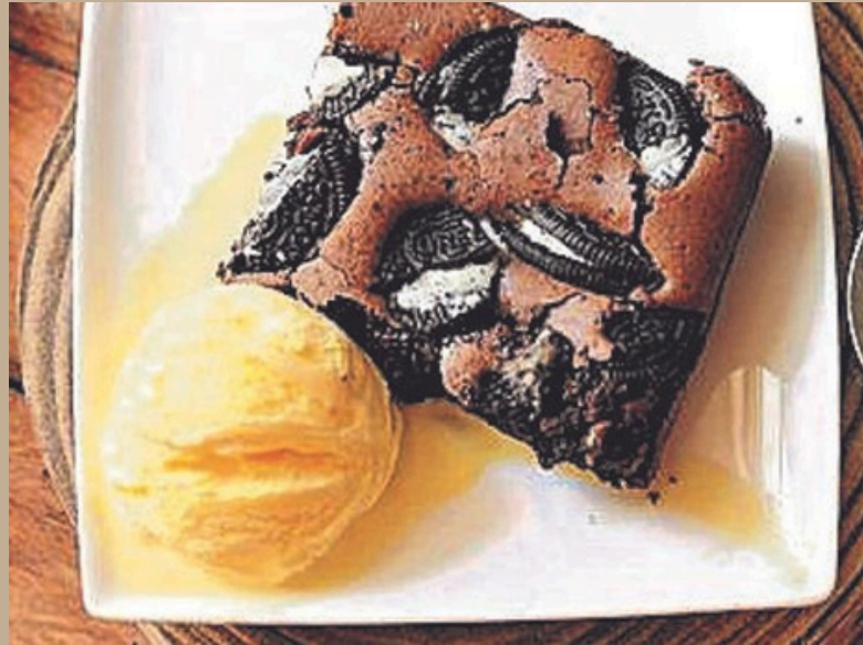
Brownie de galleta oreo

Esponjoso brownie de chocolate con galleta y helado de vainilla.