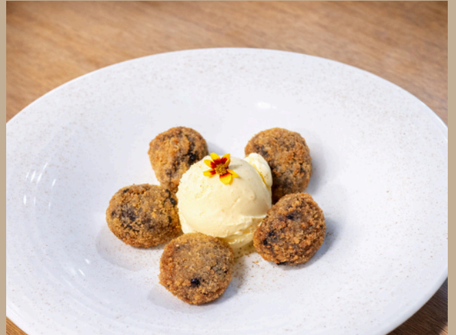
Croquetas de chocolate

Crujientes croquetas de chocolate con helado de vainilla.