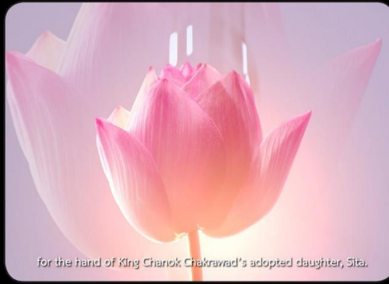
for the hand of King Chanok Chakrawad's adopted daughter, Sita.