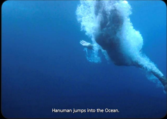
Hanuman jumps into the Ocean.