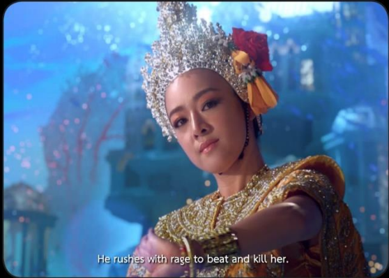
He rushes with rage to beat and kill her.